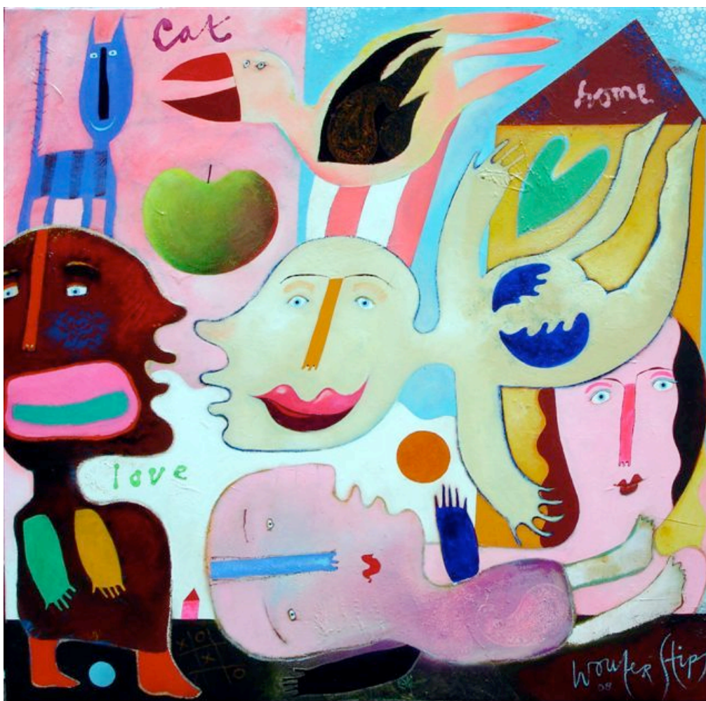
kunstenaar wouter stips maakte de hoes voor zoenen van chocola