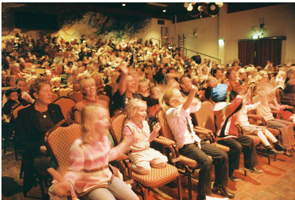
enthousiast publiek bij Herrie met de Sint, 2002

de met een * gemerkte voorstellingen zijn jeugdvoorstellingen